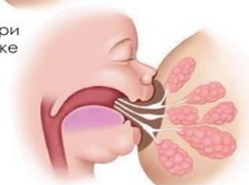
2. Захват груди новорожденным при короткой уздечке языка